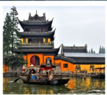
หมู่บ้านโบราณจูเจียเจียว

สวนสนุกยูนิเวอร์แซลปักกิ่ง / สวนสนุกเซี่ยงไฮ้ดิสนีย์แลนด์ / หมู่บ้านโบราณจูเจียเจียว ขึ้นหอไข่มุก / ลอดอุโมงค์เลเซอร์ / หาดไว่ทาน / จัดธุรกิจอันheimin พระราชวังโบราณกู่กง / กำแพงเมืองจีนด่านจี้หยงกวน สนามกีฬาโอลิมปิกปักกิ่ง / ถนนโบราณเจียนheimin