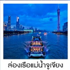
ล่องเรือแม่น้ำจูเจียง

ล่องเรือแม่น้ำจูเจียง / ช้อปปิ้งถนนปักกิ่ง / ช้อปปิ้งถนนซิงเซี่ยจิว / วัดไทรหัดตัน / ศาลเจ้าตระกูลเฉิน / ถนนคนเดินหย่งซิงฟาง