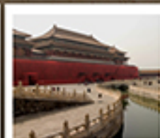
พระราชวังกรุงปักกิ่ง