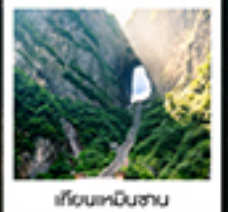
เวียงหนินชาน

แรมดีเทลนอน / สพานกั๋วเฟี้ยวโจว / เขาคิโยนหนินชาน / เรือชิงกั๋ว / ประตูสวรรค์ / ไร่มังกรจิ้งจอกขาว / เขาคิโยนหนินชาน สวนจอนเฟยเจ็ดคลอง / ภาพวาดทราย / เมืองฟูหลงเจิน / ล่องเรือตามลำน้ำตงเจียง / เขามือโบราณฝ่งหวงยกน้ำดื่ม