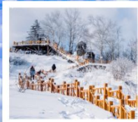
เขากระหลว้า