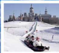
คฤหาสน์วอลการ์