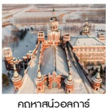
คฤหาสน์วอลการ์