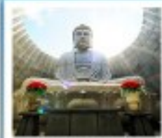
เนินพระพุทธรูป