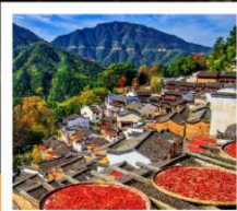
หมู่บ้านหวงหลิ่ง