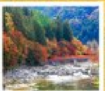
หุบเขาโทริเอะ

ฮารุชิยาม่า / สอนัง / สวนทามะยาม่า / 50ไร่ทุ่ง / 50ไร่บึง / ปราสาทโทริเอะ / ไบบะ / หุบเขาโทริเอะ / ฝักร่องน้ำใส โถ้งมะฮิดากะ / สวนโตะยามะ / ฮิมเม็งฮิมรุกุ / 50ไร่ทุ่ง / 50ไร่บึง / 50ไร่บึง / 50ไร่บึง