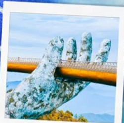
บาน่าฮิลล์