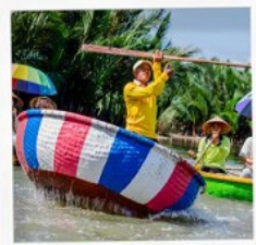
เรือกระดิง