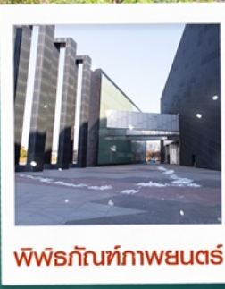
พิพิธภัณฑ์ภาพยนตร์