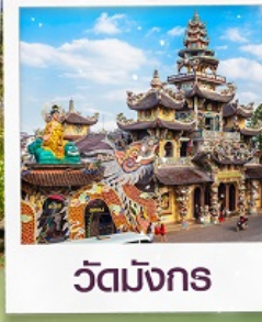
วัดมังกร