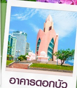
อาคารตอกบัว