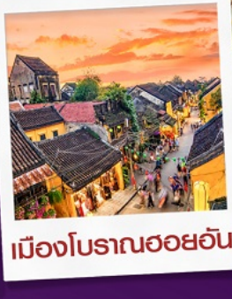
เมืองโบราณฮอยอัน