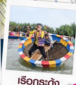
เรือกระด้ง