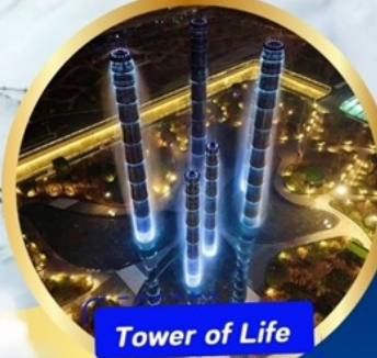
Tower of Life