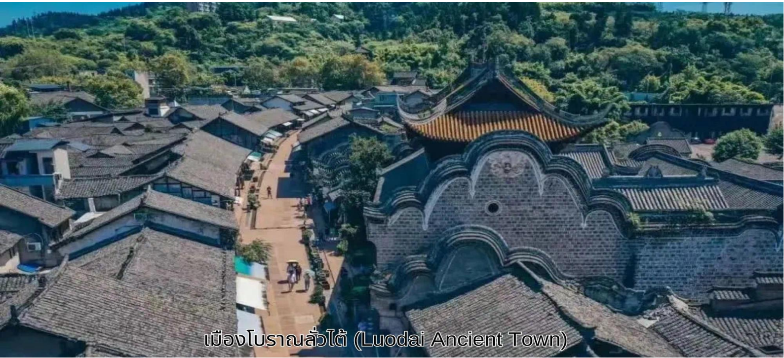
เมืองโบราณลั่วไต้ (Luodai Ancient Town)