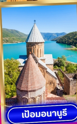
เปอนอนาบูรี