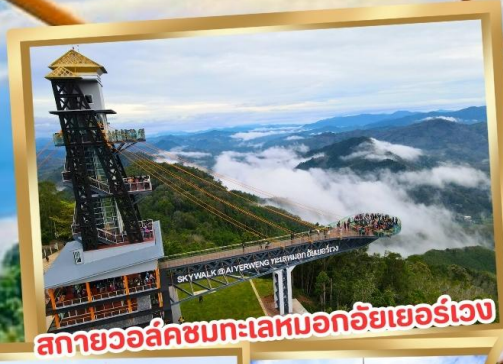
สกายวอล์คชมทะเลหมอกอัยเยอร์เวง