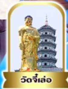
วัดจี่เล่อ