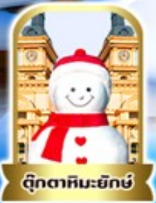
ตุ๊กตาทิม-ยักซ์