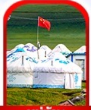
หมู่บ้าน พื้นเมือง