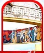
อนุสาวรีย์ โซซาน