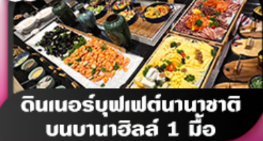
ดินเนอร์บุฟเฟ่ต์นานาชาติ บอนบานาฮิลล์ 1 มื้อ