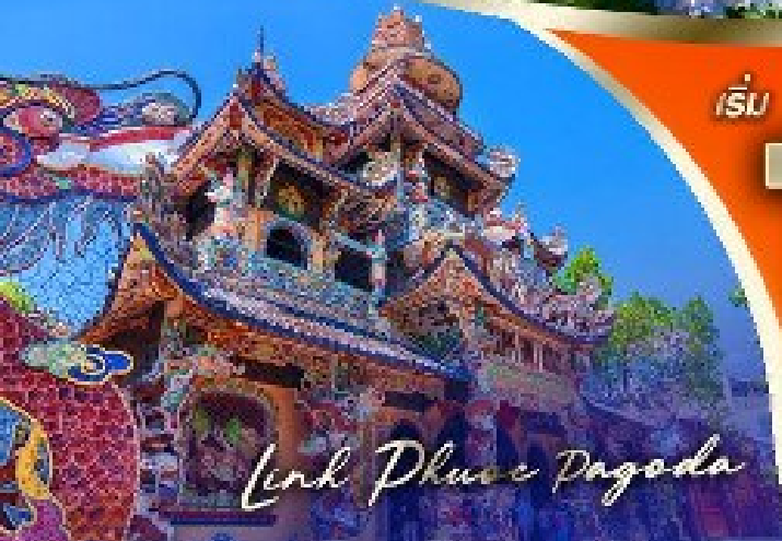
Linh Phuoc Pagoda