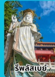
รีพลีสเบย์

3 วัน 2 คืน เดินทาง พฤศจิกายน 2567 3-5 / 10-12 17-19 / 24-26