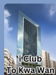
i Club To Kwa Wan

คอนเฟิร์มเดินทาง พฤศจิกายน 2567 2-4 / 9-11 / 16-18 23-25 / 30 พ.ย. - 2 ธ.ค.