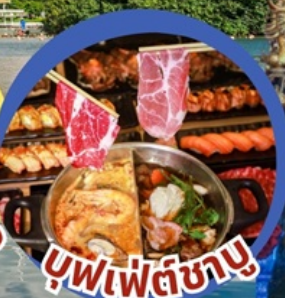
บุฟเฟต์ชาบู