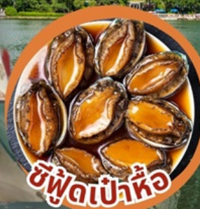
ซีฟู้ดเป่าหื้อ