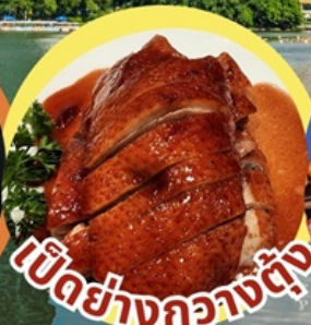
เป็ดย่างกวางตุ้ง