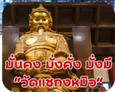
มันคง มั่งคั่ง มั่งมี "วัดเซกองหมิว"