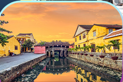
เมืองเก่า Hoi An