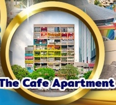
The Cafe Apartment