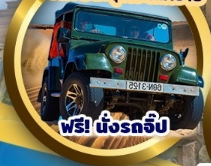
ฟรี! นั่งรถจี๊ป