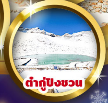
ต่ากู่ปิงชว่น