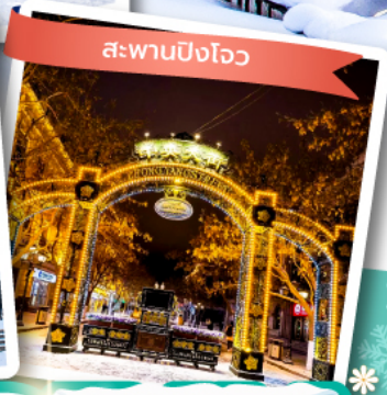
สะพานปิงโจว