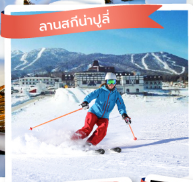
ลานสกีน้ำปู๋ลี่