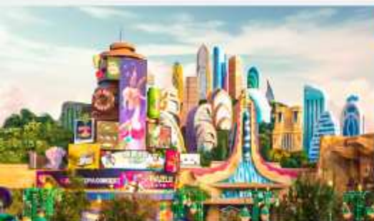
ดิสนีย์แลนด์