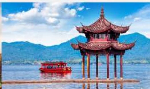
ล่องเรือชมทะเลสาบซีหู