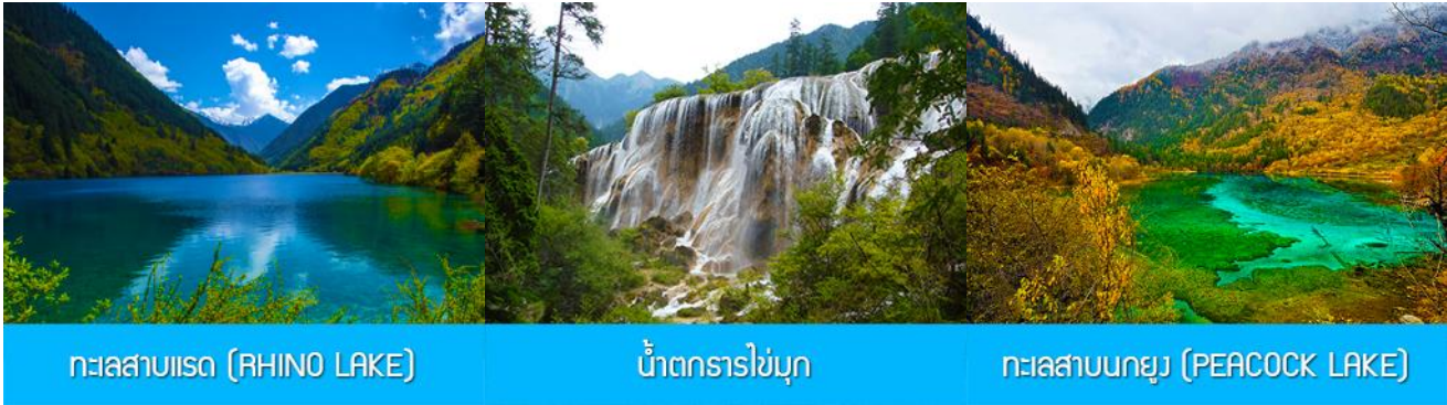
ทะเลสาบแรด (RHINO LAKE)

หลังอาหารเช้านำท่านเดินทางสู่ อุทยานแห่งชาติจิวจี้โกว (JIUZHAIYOU NATIONAL PARK) ตั้งอยู่ด้านทิศเหนือของมณฑลเสฉวน ซึ่งเป็นส่วนหนึ่งในบริเวณตอนใต้ของเทือกเขาหิมิงซาน ห่างออกไปจากตัวเมืองเฉิงตูราว 500 กิโลเมตร จิวจี้โกวมีชื่อเสียงด้านความงามแห่งสีสันที่แปลกเปลี่ยนไม่รู้จบ ทะเลสาบผุดขึ้นท่ามกลางหมู่แมกไม้เขียวชอุ่ม น้ำใสเป็นประกายชุ่มฉ่ำ ยอดเขาหิมะตัดกับท้องฟ้าสีคราม เกิดเป็นภาพธรรมชาติอันงดงามที่แปรเปลี่ยนไปตามฤดูกาลผลิ ด้วยความสวยงามจึงทำให้อุทยานแห่งชาติจิวจี้โกว ได้ถูกขึ้นทะเบียนเป็นมรดกโลกทางธรรมชาติ ในปีค.ศ. 1992