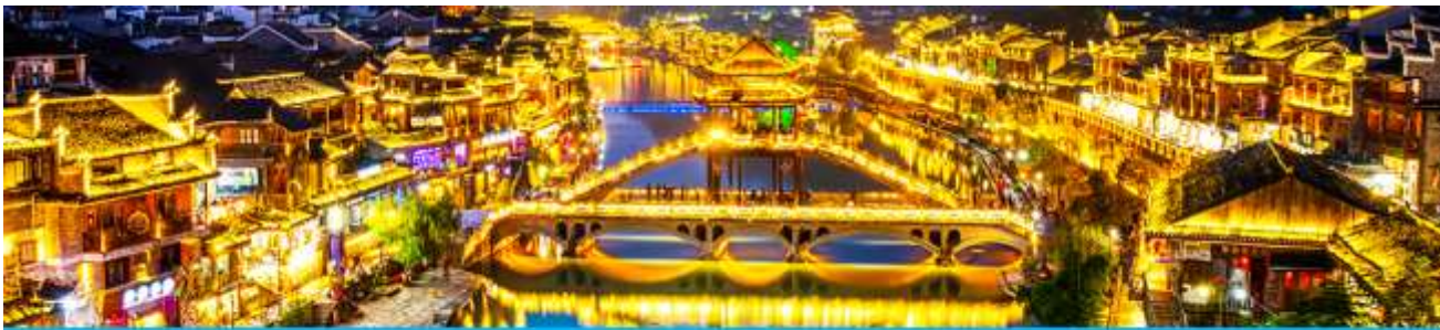
เมืองโบราณฟงหวง

จากนั้นนำท่านเดินทางสู่ เมืองโบราณฟงหวง (เมืองหงส์) 凤凰古城 ใช้เวลาเดินทางประมาณ 2 ชั่วโมง เมืองนี้ตั้งอยู่ในเขตปกครองตนเองของชนเผ่าถู่เจีย ตั้งอยู่ริมแม่น้ำฉวี่เจียงทางทิศตะวันตกของมณฑลหูหนาน ล้อมรอบด้วยขุนเขาเสมือนด่านช่องแคบภูเขาฟงหวง ตั้งเด่นตระหง่านเสมือนป้อมปราการ ชาน้ำฉวี่เจียงใสสะอาดราวน้ำบริสุทธิ์ที่ถูกคลื่นกลองจมองเห็นกันลำธาร ชุมชนที่เป็นบ้านเรือนจีนโบราณแบบยกพื้นสูงเรียงรายกันริมแม่น้ำ ช่างเป็นทัศนียภาพที่สวยงามมีเสน่ห์ของเมืองโบราณฟงหวง ราวกับดินแดนมนุษย์ที่สร้างอยู่บนสวรรค์.. *** นำท่านนั่งรถเมล์ของเมืองโบราณฟงหวงเข้าสู่โรงแรมในเมืองเก่า * กระเป๋าสัมภาระรวมค่าพนักงานขนจากรถบัสไปโรงแรมแล้ว