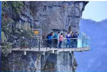
หน้าพลาวยฟ้าทางเดินกระจก