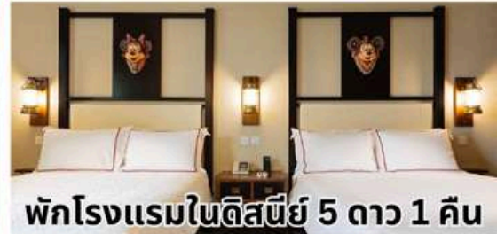
พักโรงแรมในดิสนีย์ 5 ดาว 1 คืน