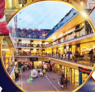
ถนนช้อปปิ้งอินชาง