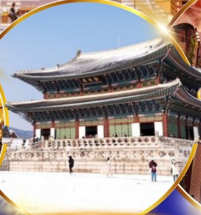
พระราชวังเคียงบกคุง