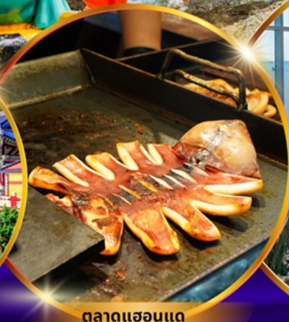
ตลาดแฮอนแด