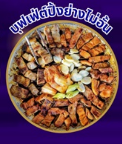
ซูฟเฟิลปูย่างไข่น้ำ