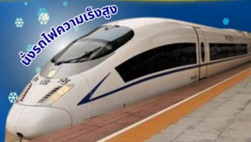
ขบวนไฟความเร็วสูง

พักโรงแรม 4 ดาว ★★★★★ บริการอาหารท้องถิ่น