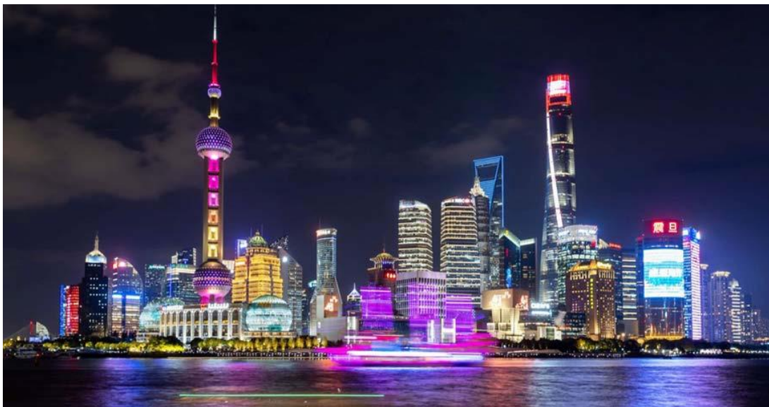
อาหารเย็น (มื้อที่1)

นำท่านเดินทางสู่บริเวณ หาดไว่ทาน (Waitan) หรือ เดอะบันด์ The Bund แม้จะถูกเรียกว่าหาด แต่ไว่ทานเป็นพื้นที่ริมน้ำในใจกลางเมืองเซี่ยงไฮ้ มีความยาว 1.5 กม. เลียบริมแม่น้ำหวงผู่ฝั่งตะวันตก เป็นสถานที่ถ่ายทำภาพยนตร์เรื่องเจ้าพ่อเซี่ยงไฮ้ ทำให้หาดนี้เป็นที่รู้จักอีกชื่อคือ "หาดเจ้าพ่อเซี่ยงไฮ้" บริเวณนี้เคยเป็นที่ตั้งของตึกที่ทำการบริษัทและสถานกงสุลประเทศต่างๆ ทั่วโลก ลักษณะของอาคารเป็นสไตล์ยุโรปโบราณ บางแห่งดัดแปลงเป็นออฟฟิศและร้านอาหารหรูๆ ถือเป็นจุดไฮไลต์ของการมาเที่ยวเซี่ยงไฮ้ ที่นักท่องเที่ยวต้องแวะมาชม