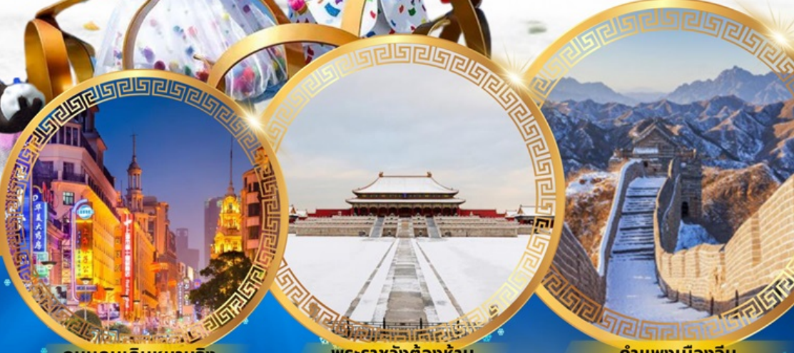
ถนนคนเดินหนานจิง