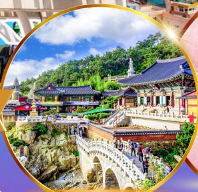
วัดแสงยงกุงซา