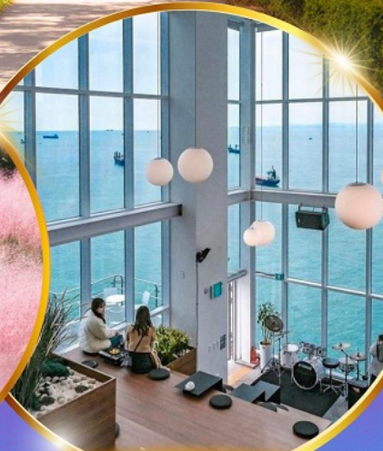
คาเฟ่วิวทะเล

ถ่ายรูปชิคๆ หมู่บ้านวัฒนธรรมคิมซอน ใหม่ล่าสุด คาเฟ่ริมทะเล วิวหลักล้าน ชมอุโมงค์ดินเมเปิ้ล สีส้มแดง ถ่ายรูปกับหย่าฮิมมพู สดใส ขึ้นเคเบิลคาร์ ชมทะเลปูซาน ห้ามพลาด!! ตลาดปลาที่ใหญ่ที่สุด ชิมของอร่อยที่ตลาดแฮจุนแด อิสระช้อปปิ้ง Lotte Duty Free