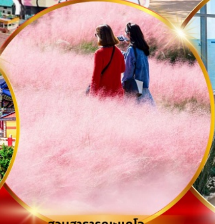
สวนสาธารณะแดโจ