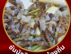
ซันนั๊กจิ อาหารท้องถิ่น