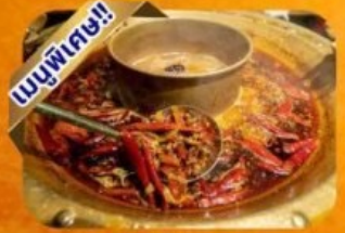
หม้อไฟเสฉวน

พักโรงแรม 4 - 5 ดาว ฟรี ประกันอุบัติเหตุ บริการ อาหารท้องถิ่น