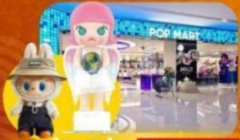
ข้อปึงจุ่ม POP MART