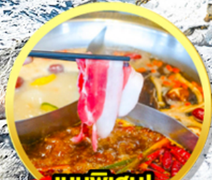
เมนูพิเศษ! สุกี้หม่าล่าเสฉวน