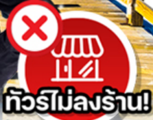
✗ ทิวรี่ไม่ลงร้าน!