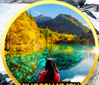
ชมความงดงาม อุทยานจิว๋จ้ายโกว