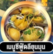
เมนูซีฟู้ดลิ้นจี่อบนึ่ง