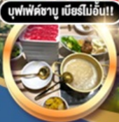
บุฟเฟ่ต์ชาบู เมื่อก่อนนี่!!