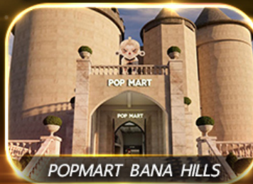
POP MART BANA HILLS

สัมผัสความงามหมู่บ้านฝรั่งเศสที่บานาฮิลล์ ชอปปิง POPMART