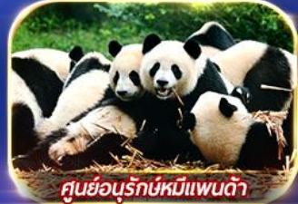
ศูนย์อนุรักษ์หมีแพนด้า