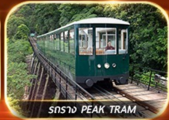
รถราง PEAK TRAM

รวมตั๋วดิสนีย์แลนด์+รถรับ-ส่ง ซอปปิงแบบจัดเต็ม พัทยานิมิตต์ชาจู้ย