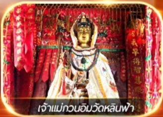
เจ้าแม่กวนอิมวัดหลินฟ้า