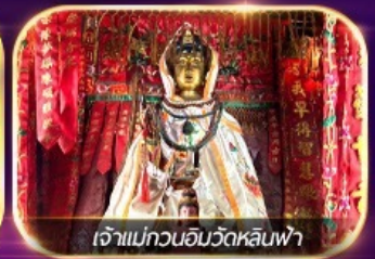
เจ้าแม่กวนอิมวัดหลินฟา

เต็มอิ่มทั้งบุญ และ ซอปปิงแบบจัดเต็ม จิมซาจุ่ย มงก๊อก