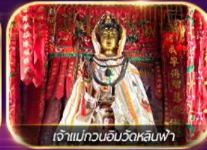
เจ้าแม่ทวนอิมวัดหลินฟ้า

เต็มอิ่มทั้งบุญ และ ซอปปิงแบบจัดเต็ม จิมซาจุ่ย มงก๊ก