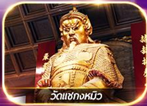
วัดเซกกงหมิว