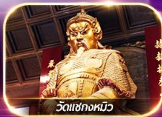
วัดเชกวงหมิว