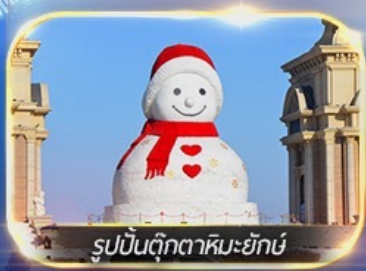
รูปปั้นตุ๊กตาหิมะยักษ์