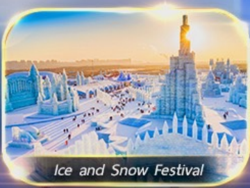
Ice and Snow Festival