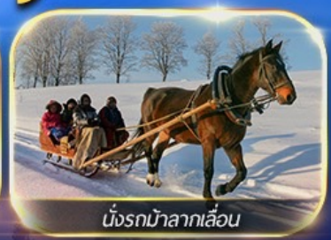
นั่งรถม้าลากเลื่อน

พักหมู่บ้านหิมะ ชมแสงสียามค่ำคืน ฟรีนั้งรถม้าลากเลื่อน