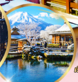
หมู่บ้านไอชิโนะฮัทโก

39,919 ราคาเริ่มต้น บาท รวมภาษีมูลค่าเพิ่ม 7%