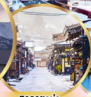
ทากายาม่า