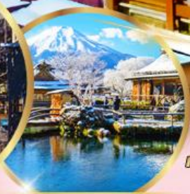
หมู่บ้านโอชิโนะฮัทโท

39,919 ราคาเริ่มต้น บาท รวมภาษีมูลค่าเพิ่ม 7%