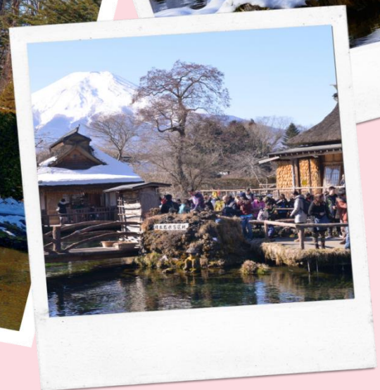
หมู่บ้านน้ำใส โอชิโนะ ฮักไก