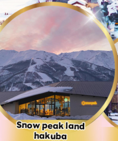
Snow peak land hakuba