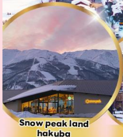
Snow peak land hakuba