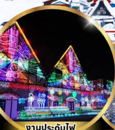
งานประดับไฟ