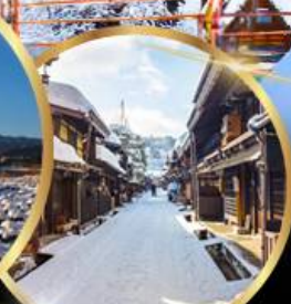
ตากายาม่า