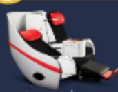
ราคาเริ่มต้นที่ 1,500 / ที่นั่ง

Premium Flatbed ที่นั่งสุดพิเศษขนาดกว้าง 19 นิ้ว ที่ความยาวของที่นั่ง 99 นิ้ว สามารถปรับเบาะที่นั่งได้ 3 องศา พร้อมด้วยเบาะหนังนุ่มนวล ให้คุณกับการเดินทางที่สะดวกสบาย