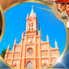
โบสถ์สิชมพู่