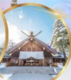
ศาลเจ้าฮอกไกโด