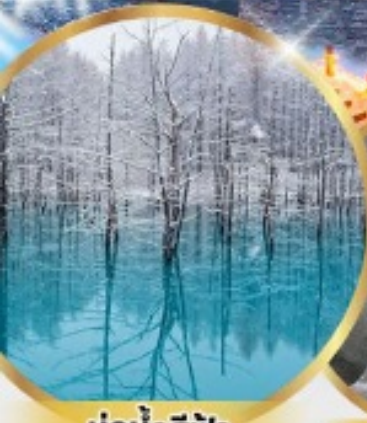
บ่อน้ำสีฟ้า