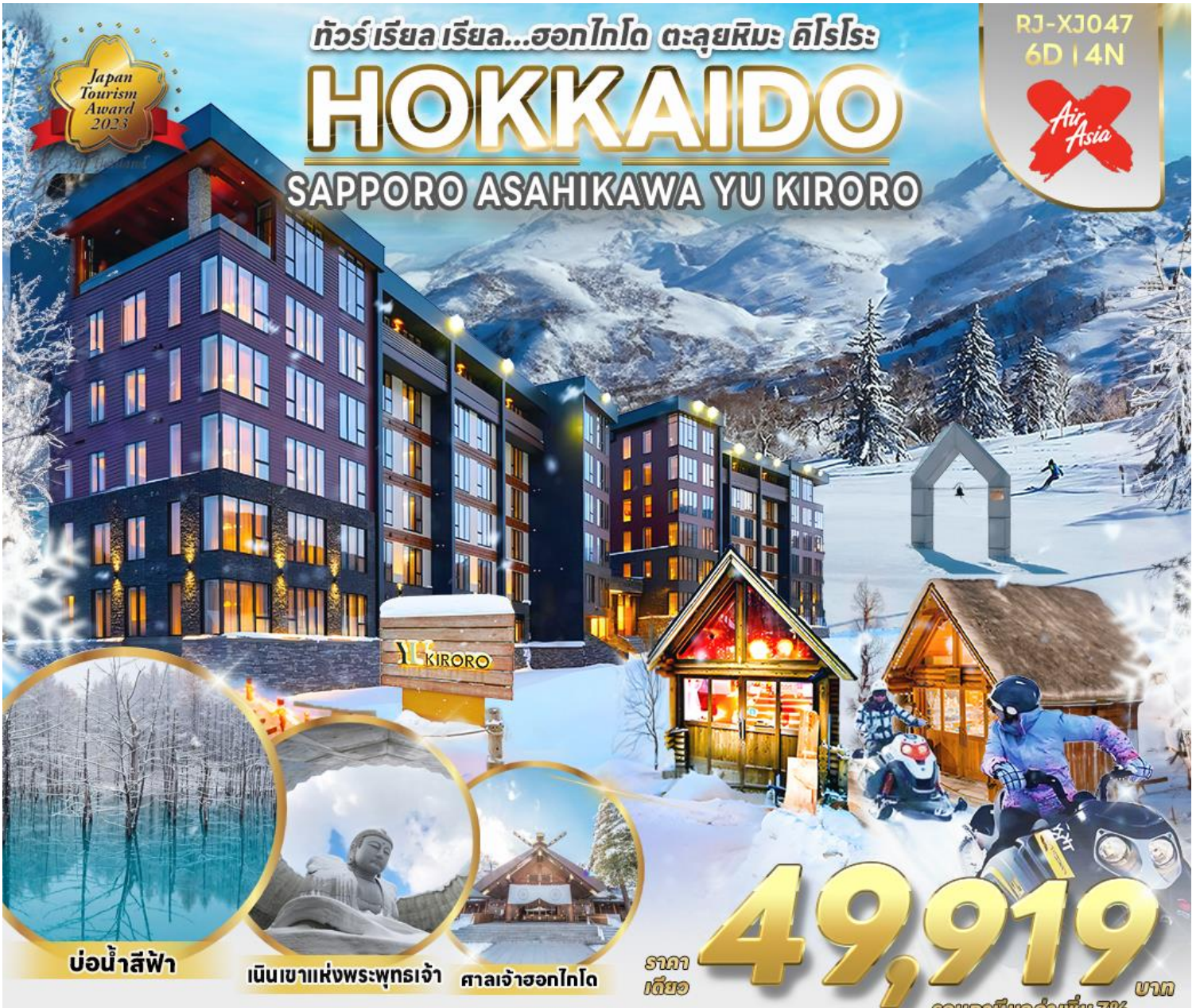
บ่อน้ำสีฟ้า